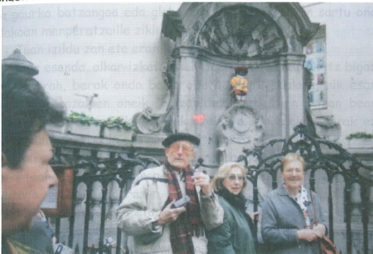
Argentina'tik etorritako "GEARLE" ta emaztea izan genduzan bide lagun

me Ango gauza politenak ikusi eta BRUSELAS`era zuzendu genuen bidea.